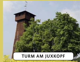
TURM AM JUXXKOPF

schen Alb reicht. Der Turm wird vom Schwäbischen Albverein betreut und ist an Sonntagen geöffnet und bewirtschaftet. Neben dem Turm gibt es einen Grillplatz.